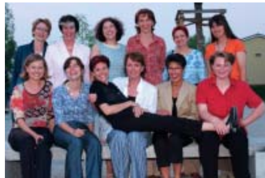
Teilnehmerinnen Schule für die Geschäftsfrau Klasse 2002/2003

Geben auch Sie sich einen Ruck, melden Sie sich an. Oder kommen Sie zu unserem Informationsabend am 29. April 2004 in Sursee. Wir freuen uns auf Sie!